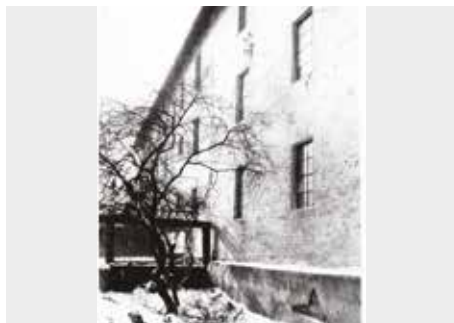
Horní mlýn, jižní trakt.