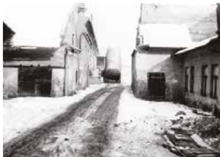
Život na mlýně, 20. století