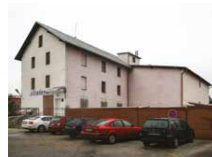
Současný stav Horního mlýna z nádvoří firmy ZlínTerm (foto: TIC Otrokovice)

Soupis majitelů Horního mlýna připomíná se nám až díky nájemní smlouvě, kterou roku 1721 podepsala vdova Anna Margarita, poručnice dědiců sirotek. V této nájemní smlouvě již figuruje mlýn jako otrokovský mlýn, ačkoliv měl již za sebou skoro 200 let své existence. Důvodem této pozdní zmínky o mlýně je jeho plánovaná přestavba ze zařízení na lisování olejů na obilní mletí, čímž jako by se zařadil mezi mlýny hodné zápisu. Od pro mlýn přelomového roku 1721 tedy můžeme sledovat jeho majitele nebo nájemce.