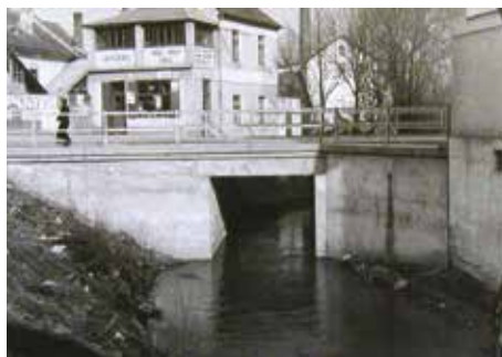
Mostek přes mlýnský potok, v pozadí lze vidět Horní mlýn s komínem, památkem na éru parního pohonu mlýna.

Péče o mlýnský náhon a vodní mlýnskou soustavu byla nikdy nekončící práce. Potok bylo potřeba čistit od nánosů bahna a starat se o dodržování zákonů vodního práva. Nad celou vodní soustavou bděl vodní úřad a byly posílány komise pro přísné posouzení stavu náhonu a jezu.