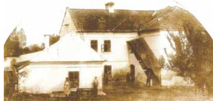
Horní mlýn před velkou rekonstrukcí (archív KPHMO)