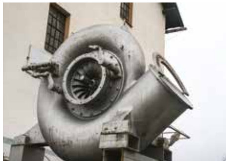
Francisova turbína, zachráněná z turbínové kašny, nahradila na začátku 20. století vodní mlýnské kolo.