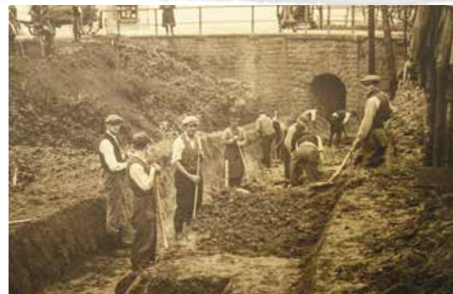
Péče o mlýnský náhon.