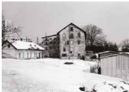
Horní mlýn, 80. léta 20. století. Nízká budova vedle mlýna sloužila jako kanceláře a byt účetního.