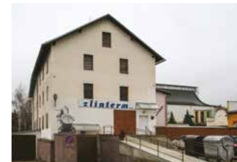
Pohled na Horní mlýn z východu