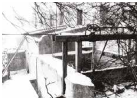
Kde dříve protékal náhon na mlýnské kolo vantroky, byla později zbudována turbínová kašna se stavidly regulujícími výšku přitékající vody.