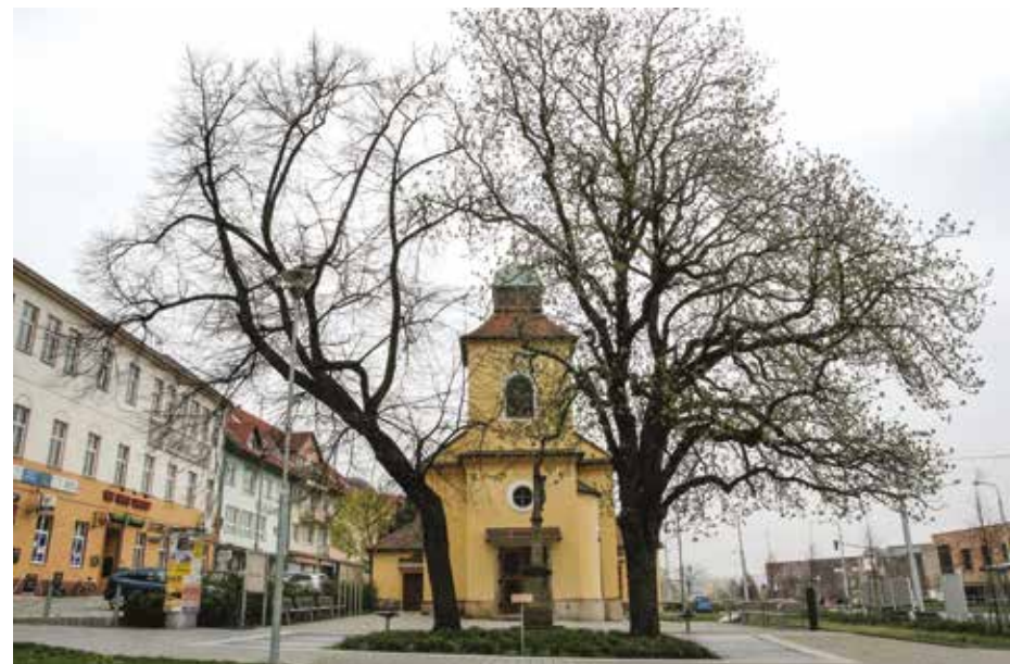
Kostel sv. Michaela

Kostel sv. Michaela byl postaven teprve v letech 1769 – 1772. Předtím lidé chodili dlouhá léta do kostela do Napajedel, kde se také pohřbívalo. Snad z feudální tradice se chodilo i do kostela do Tečovic tzv. Mešní cestou, dnešní ulicí Hložkovou.